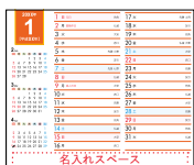
メモ付カレンダー②