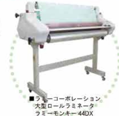
■ラミーコーポレーション 大型ロールラミネータ ラミーモンキー 44DX