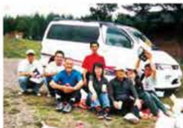
当時からレクリエーションも充実