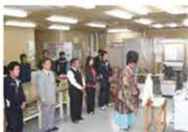
平成27年8月 四六半切カラー印刷機2台目導入