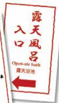
温泉ホテル様 各種プレート