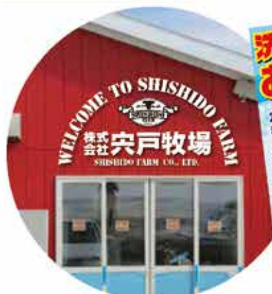
株式会社穴戸牧場様 表札看板デザイン