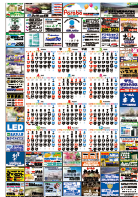
協賛広告入り年間カレンダーをプレゼント

年賀状印刷を期間限定割引料金でご提供の他、当社にご来店にてご注文いただいたお客様に限り、景品がその場で当たるスピードくじ、オリジナルカレンダープレゼントなど、毎年ご好評いただいております。