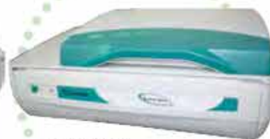
■ FUJIFILM デジタルカラーキャナ Lanovia Quattro (2台)