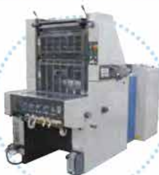
■RYOBI製 菊四切単色機 510