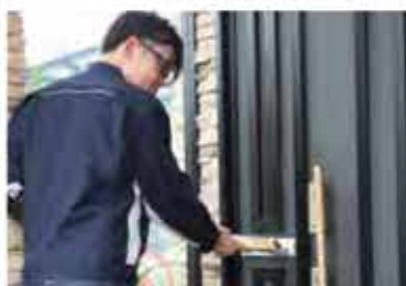
年賀まつりブックレット ポスティング