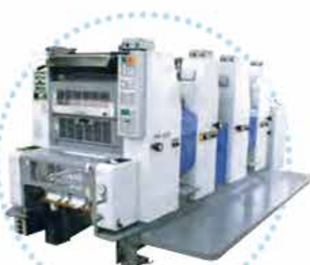
■RYOBI製 菊四切4色機 524HXX