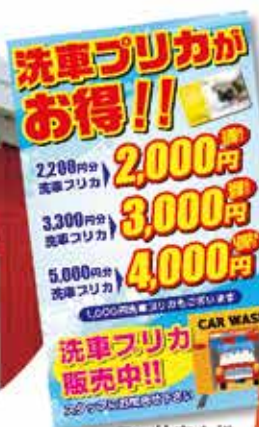
ミツ輪商会様 イベント看板