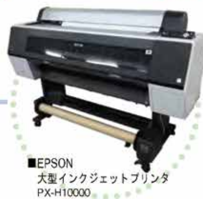
■EPSON 大型インクジェットプリンタ PX-H10000