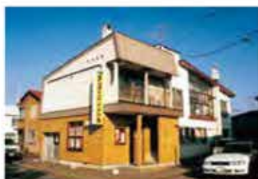
サンケイプリント社旧社屋

創業64年、法人設立から29年 変化を進化に、常に前向きに 新たな可能性を創造していきます