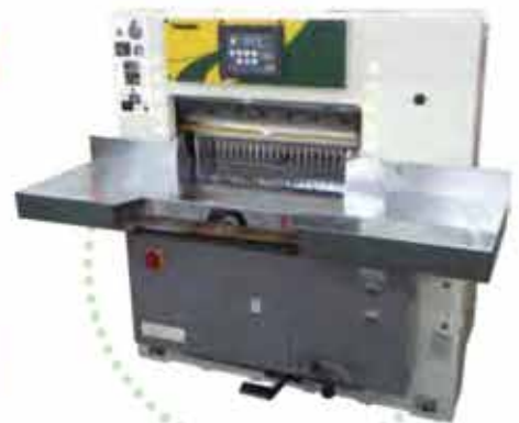
■永井機械製作所製 菊判半切型断裁機 NC-64HFE1