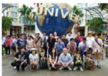
法人設立20周年 シンガポール研修旅行