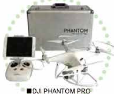
■ DJI PHANTOM PRO