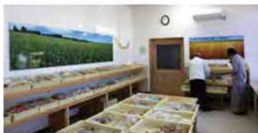
有限会社日日ベーカリー様 店内ディスプレイ

各種看板・バナースタンド・等身大パネル・スタンド看板・ブース装飾を始めとした販促アイテムを提供いたします。「こんなバナーが欲しい!」「あんな看板が作りたい!」など、様々なご要望にお応えします!