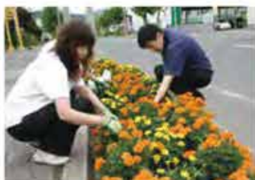
夏、会社前を彩る花壇の整備