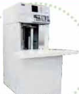
■ウチダテクノ製 紙枚数計数機 カウンtron2200