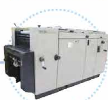
■RYOBI製 ナンバリング機NP500