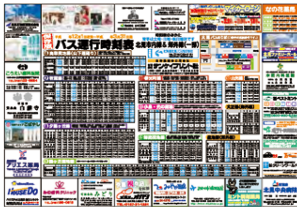
545 mm×282.5 mm 両面カラー印刷