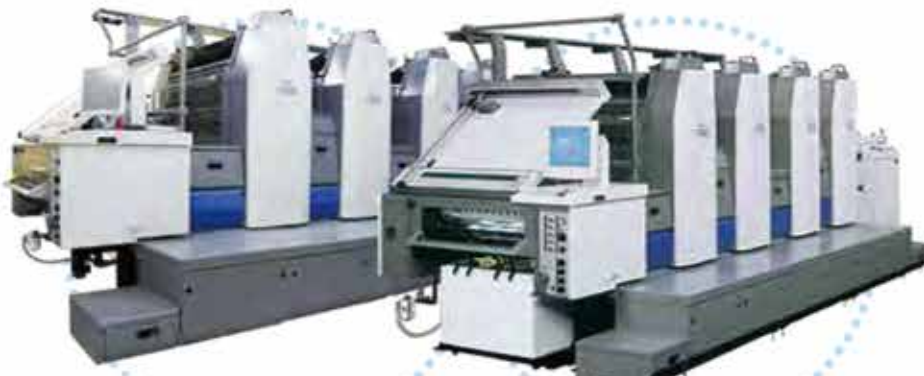
■RYOBI製 四六半切4色反転機 784EP (2台)