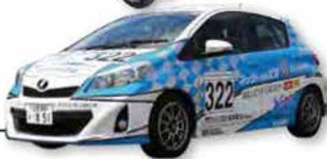
ネットトヨタ北見株式会社様

バスや営業車などに広告を掲載するラッピング広告は、年々需要を高めており、広告手法のひとつとして認知されてきたといえます。