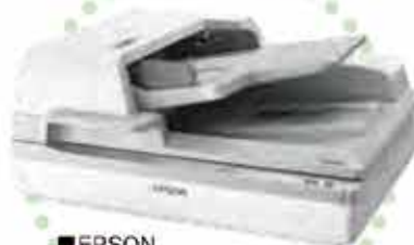
■ EPSON デジタルカラーキャナ DS-60000