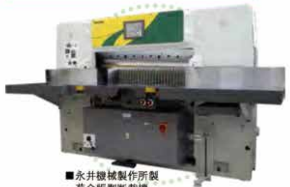
■永井機械製作所製 菊全版型断裁機 NCW-102HHE1