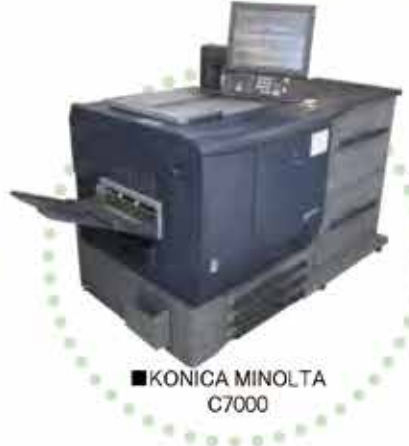
■KONICA MINOLTA C7000