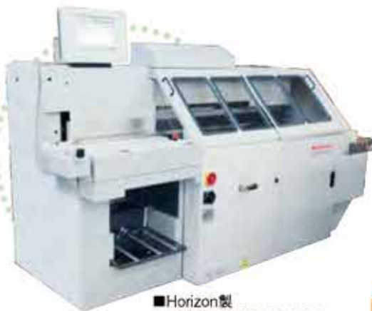
■Horizon製 自動無線綴機 BQ-270C