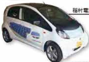
稲村電設工事株式会社様