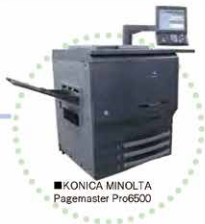
■KONICA MINOLTA Pagemaster Pro6500