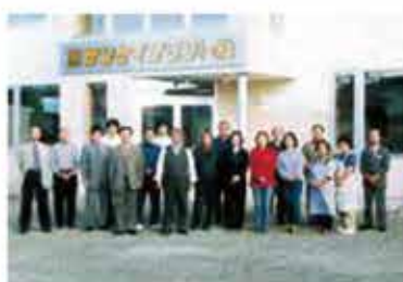
新社屋の前で全社員と記念撮影