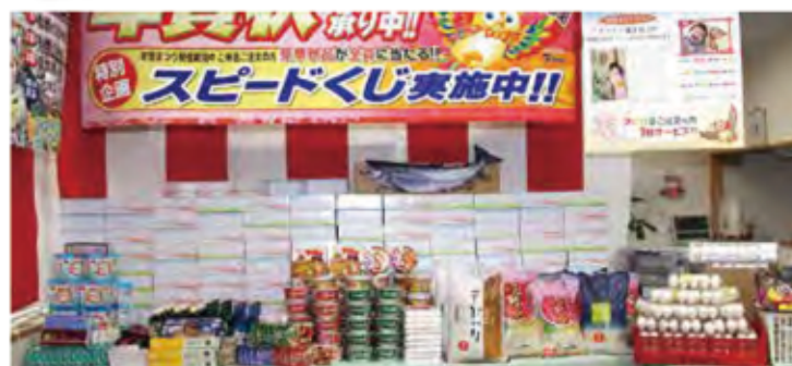
毎年様々な景品をご用意しております。