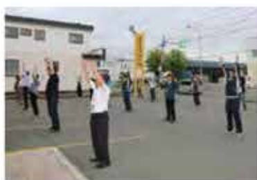
毎朝始業前にラジオ体操