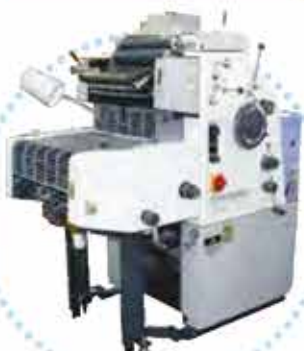
■RYOBI製 菊四切 単色機 3200CCD