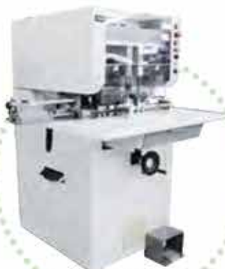
■ウチダテクノ製 自動2連穿孔機 XA-2