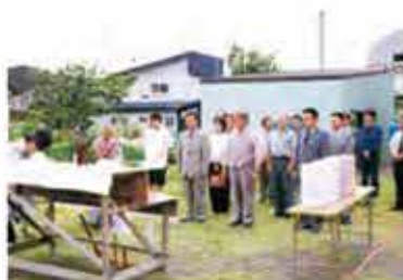
平成14年 新社屋起工式