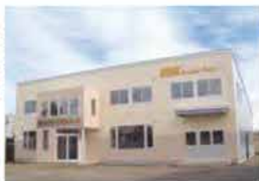
平成14年10月新社屋完成