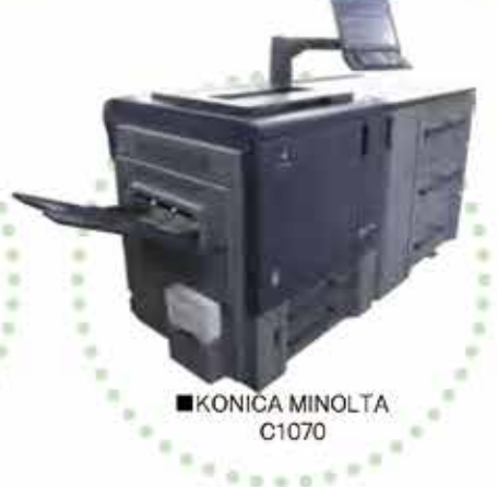
■KONICA MINOLTA C1070