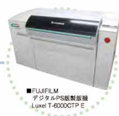
■FUJIFILM デジタルPS版製版機 Luxel T-6000CTP E