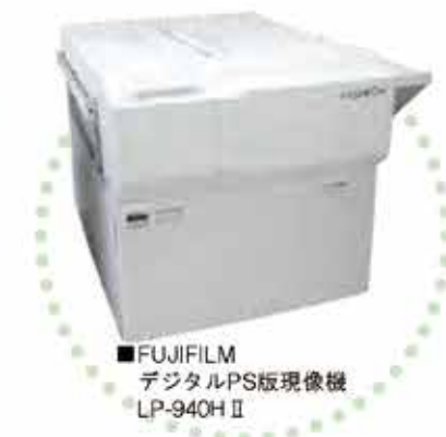
■FUJIFILM デジタルPS版現像機 LP-940H II