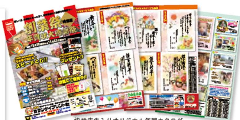
協賛広告入りオリジナル年賀カタログ